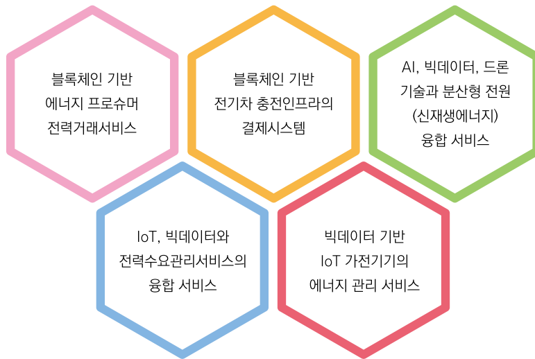
[그림 1] 에너지데이터프로슈머포럼 핵심 표준화 대상

용한 건물 에너지 관리 시스템(BEMS, Building Energy Management System) 고도화 및 건물 기자재 효율화, 에너지 빅데이터 플랫폼 및 수요관리 서비스 지원기술 개발 등 데이터 활용과 연계한 전략적 R&D 추진을 목표로 하고 있다. 이러한 환경에서 에너지 빅데이터에 대한 다